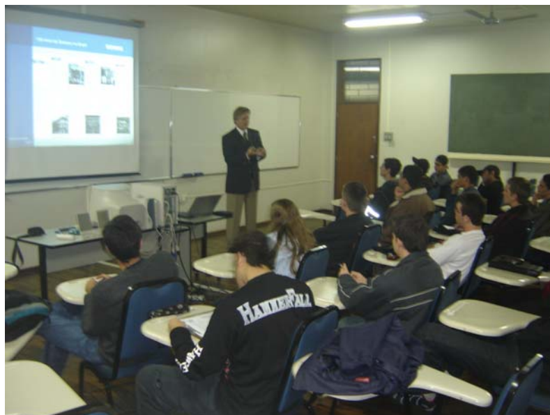
Figura 2: Fotografia da sala de aulas PK-03 no edifício do Departamento de Engenharia Elétrica da UFPR, equipada com quadros brancos, carteiras estofadas, computador e projetor multimídia.

Nos equipamentos das salas de aula houve significativa intervenção no período de 2000 a 2004, época em que o Departamento de Engenharia Elétrica recebeu o aporte de recursos significativos, fruto de um curso de Especialização em Telecomunicações, realizado com muito sucesso naquele período. Esta intervenção foi focada na modernização das instalações didáticas, obtida com a troca dos antigos quadros de giz por quadros brancos e a aquisição de carteiras estofadas com prancheta em fibra de vidro. As salas de aula foram também progressivamente equipadas com tela de projeção retrátil, projetor tipo multimídia e computador, de modo a permitir o uso de ferramentas didáticas baseadas em software . Atualmente existem cinco salas de aula com quadros brancos e recurso de projetor multimídia, restando apenas uma das salas de aula ainda com quadro de giz e carteiras antigas. A Figura 2 mostra o aspecto de uma das salas de aula modernizadas.