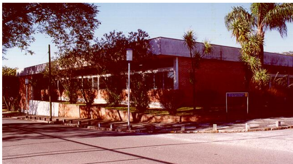
Figura 1: Fotografia do edifício do Departamento de Engenharia Elétrica da UFPR, no Centro Politécnico em, Curitiba.

Este edifício, mostrado na Figura 1, possui aproximadamente 1500 m 2 de área construída e foi concluído em 1968. Tomando partido da topografia do terreno, o projeto resultou em um edifício que em uma das faces possui dois pavimentos e, no aclave, apresenta-se com um único pavimento na face oposta. O edifício possui um estilo arquitetônico neutro e funcional, construído em uma estrutura em concreto armado com paredes externas em alvenaria de tijolos de adobe sem revestimento. A planta do edifício tem forma aproximada de um quadrado, com um jardimete central.