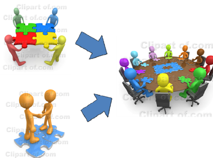
Figura 2.2: No currículo de fundamentação existencialista-constructivista, as disciplinas são apresentadas de forma inter-relacionadas umas com as outras. Incentiva-se a relação dialógica entre o professor e o aluno e entre os alunos entre si. Os alunos são conduzidos em diversos momentos a se reunirem e trocarem experiências, incentivando a solução coletiva dos problemas.

O ponto de partida para a elaboração da proposta curricular foi o pressuposto de que, durante o seu período como aluno, os futuros Engenheiros devem experimentar novas vivências que irão progressivamente redefinir os seus pensamentos, adquirindo a consciência do seu papel como elemento transformador do mundo. Propomos, com este enfoque, que o aluno seja o centro da ação pedagógica e que ele veja o ato de aprender como uma inserção apaixonada no objeto de estudo, como um mergulho em um novo mundo em que ele observe a necessidade de decodificá-lo. O projeto pedagógico foi portanto elaborado no sentido de procurar identificar as relações que existem entre os conteúdos do ensino e as situações de aprendizagem com o contexto da atuação futura do aluno como Engenheiro. O objetivo é tentar estabelecer uma relação ativa entre o aluno e o objeto do conhecimento, de modo a desenvolver a capacidade de relacionar o aprendido com o observado, a teoria com suas conseqüências e aplicações práticas.